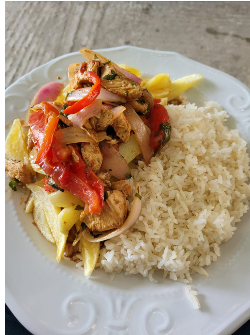
Hauptspeise: Lomo Saltado