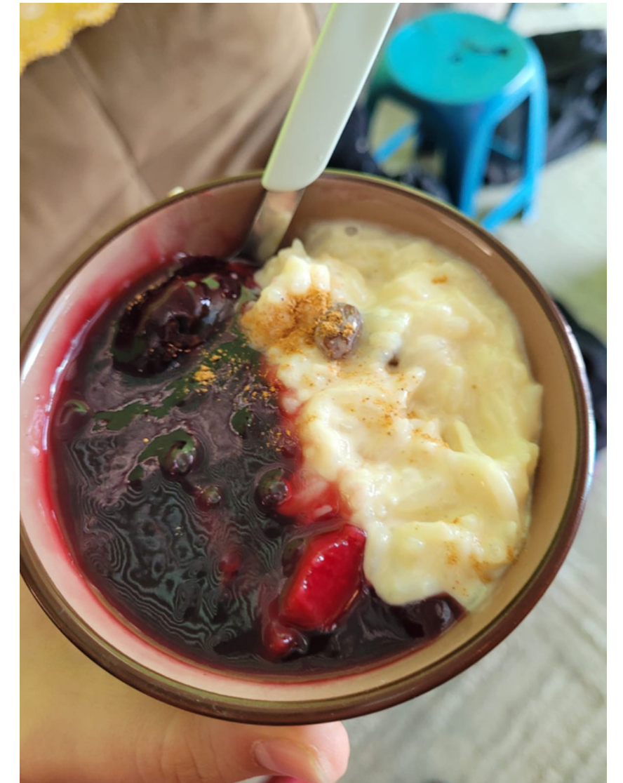
Nachspeise: Mazamorra Morada