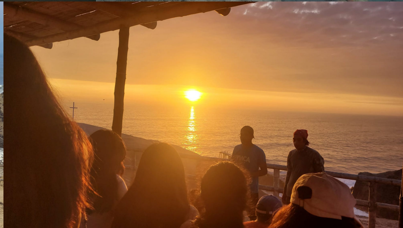
Camps am Strand