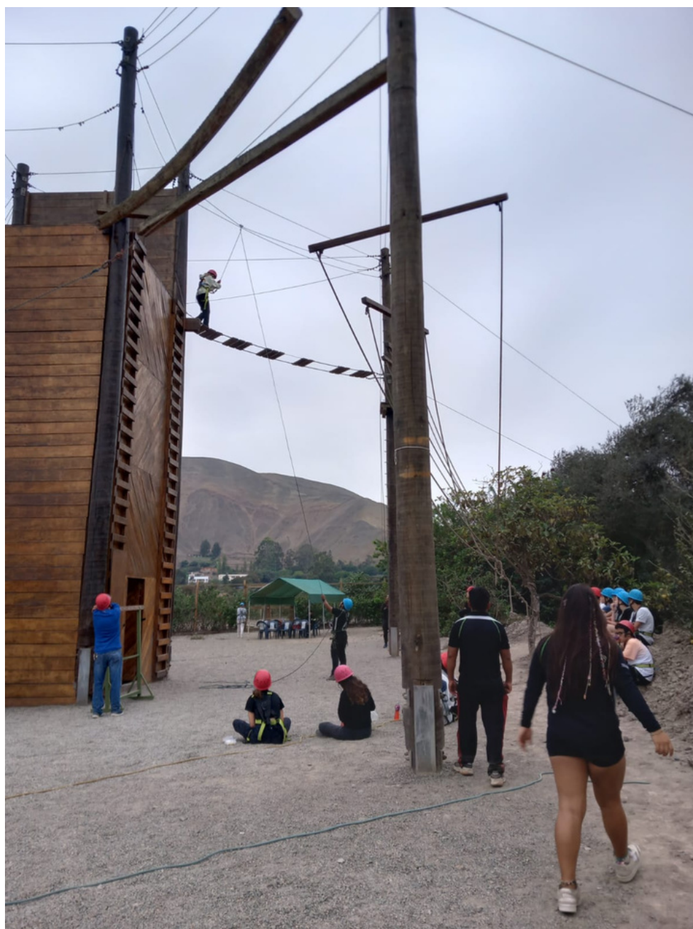
Azpitia - Hochseilgarten