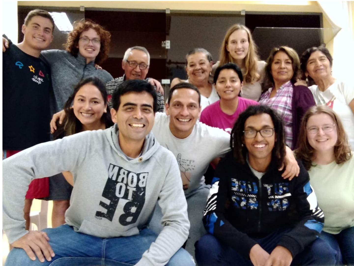
Hauskreis in Surco